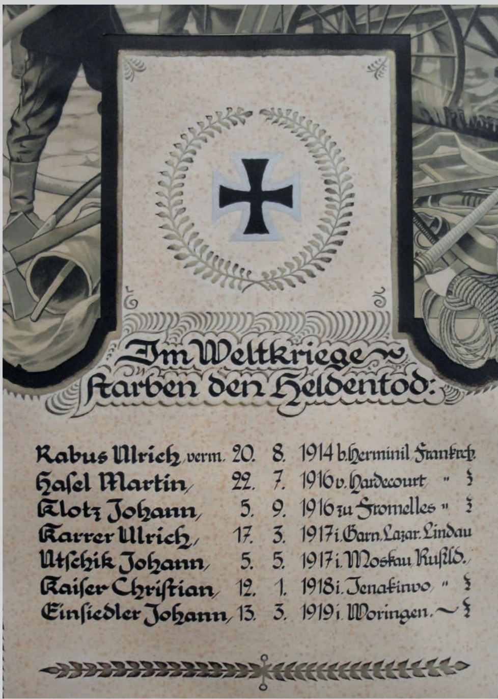
1914 - 1918 Der erste Weltkrieg forderte seinen Tribut