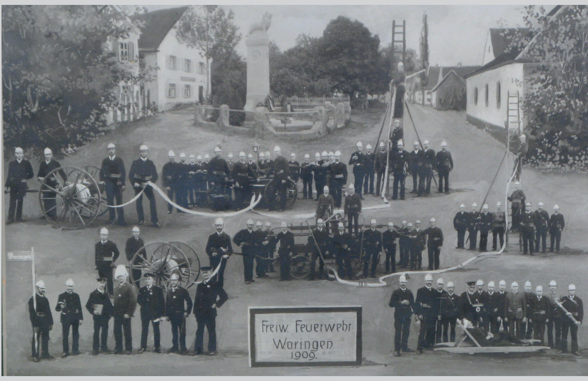
1909 Auf dem ältesten vorhandenen Mannschaftsfoto können wir sehen, wie die freiwillige Feuerwehr Woringen anno 1909 zusammengestellt war. Vorne links sehen wir das Kommando, der Kommandant trug zu seiner Erkennung einen weißen Roßhaarbusch, sein Adjutant einen roten Roßhaarbusch auf dem Helm. Rechts vorne die Rettungsmannschaft. In der Mitte dieses Bildes ist die 1. und 2. Spritzenmannschaft, mit ihren Schlauchlegern und rechts davon die dazugehörigen Steigerzüge, die geschätzten Abteilungen bei der freiwilligen Feuerwehr.