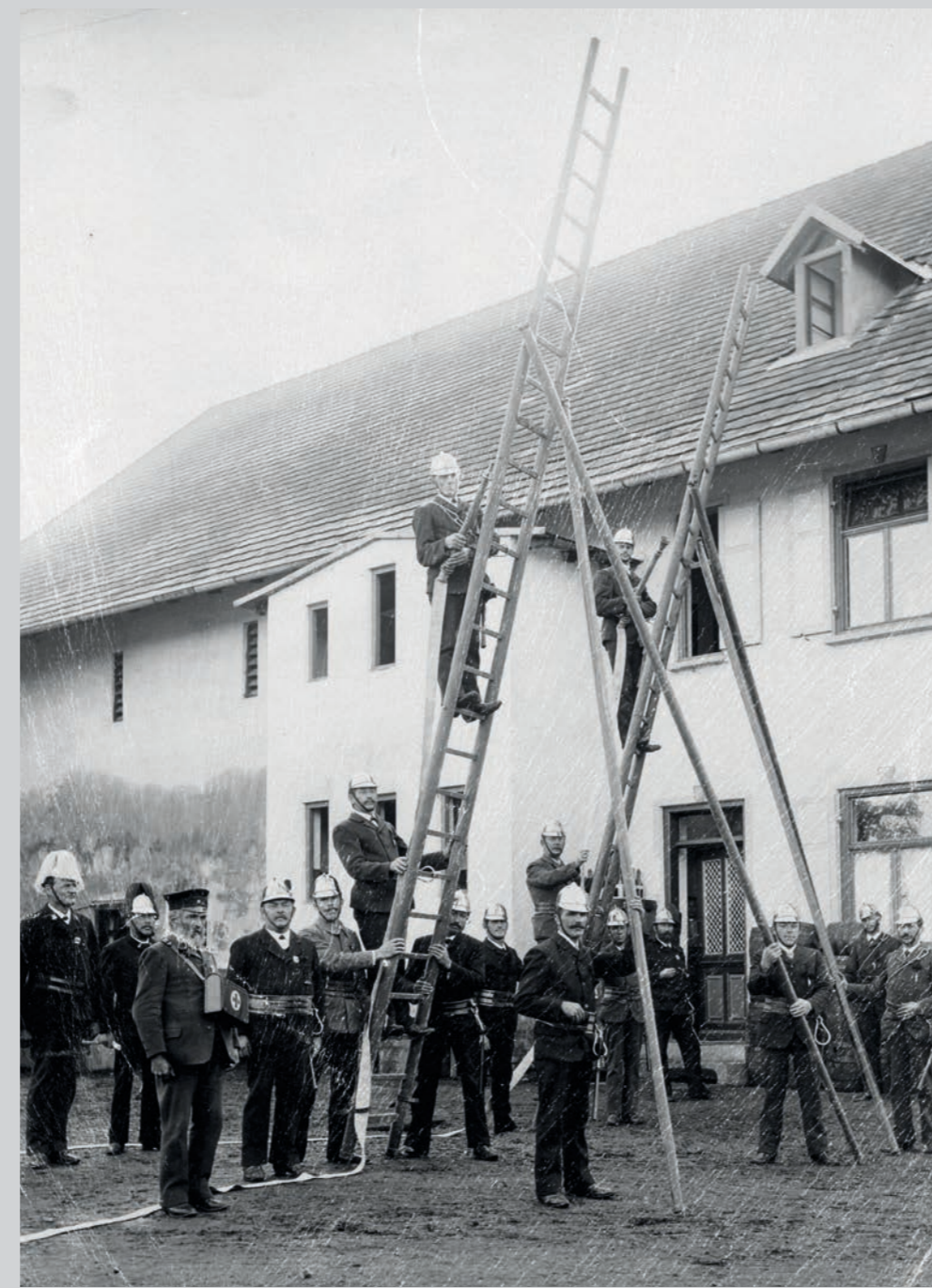
1920 Übung der Steigerzüge hinter dem Adlerwirt